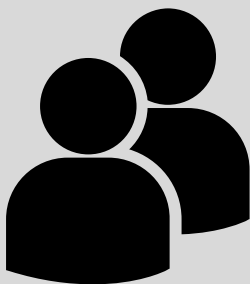
Table des organismes communautaires : MRC Avignon, MRC Bonaventure, MRC Côte-de-Gaspé;

· ROCGÎM : Regroupement des organismes communautaires de la Gaspésie et des Îles-de-la-Madeleine